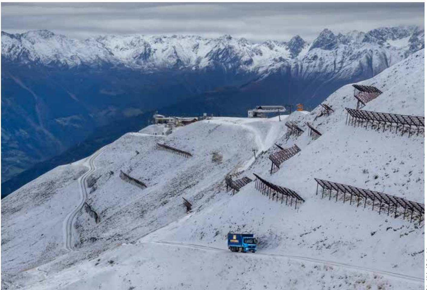
Nicht jeder Kunde ist ganz einfach zu erreichen. Belieferungen über steile Bergstraßen gehören dazu.