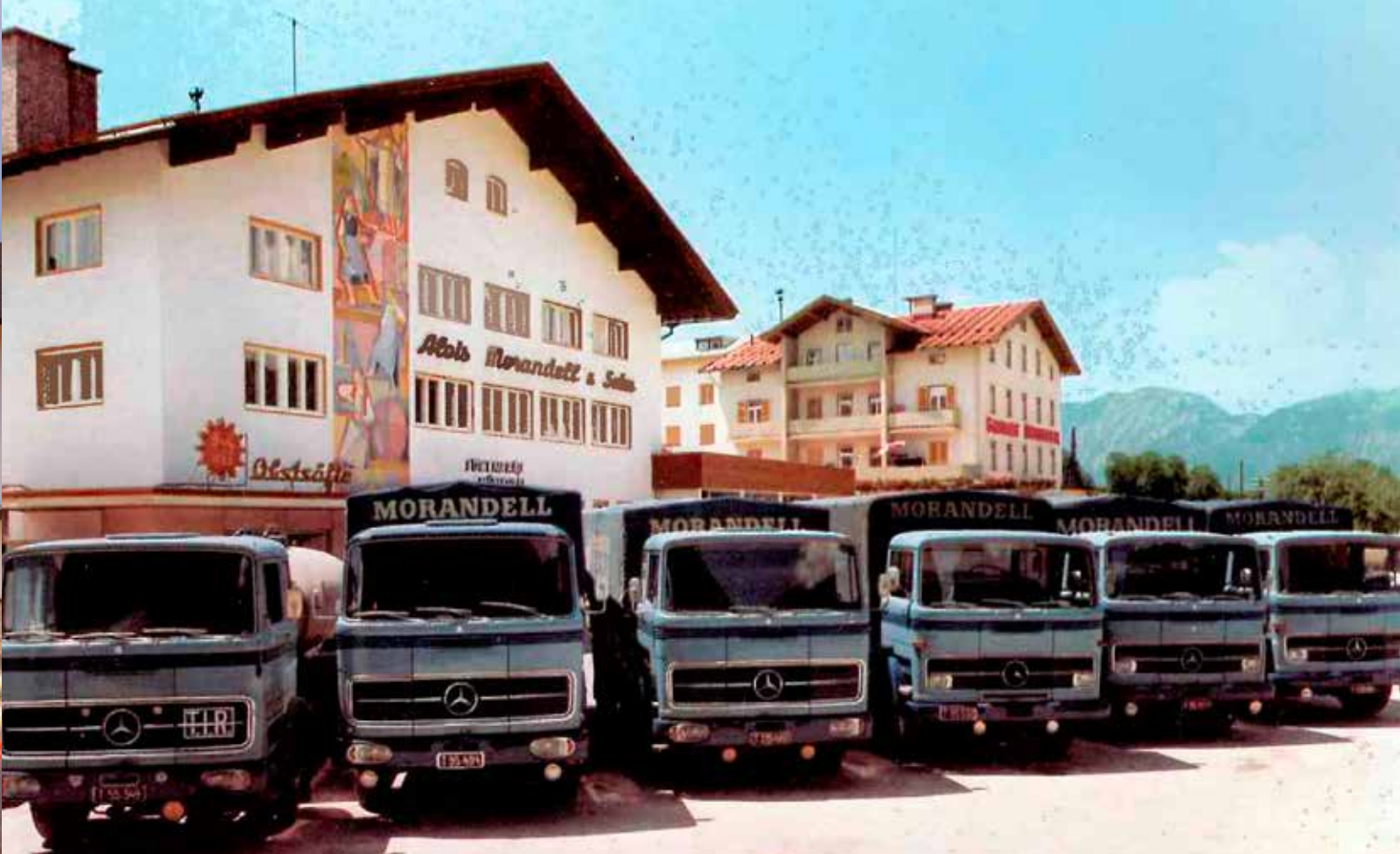
In den 60er Jahren startet der Weinexport nach Übersee.